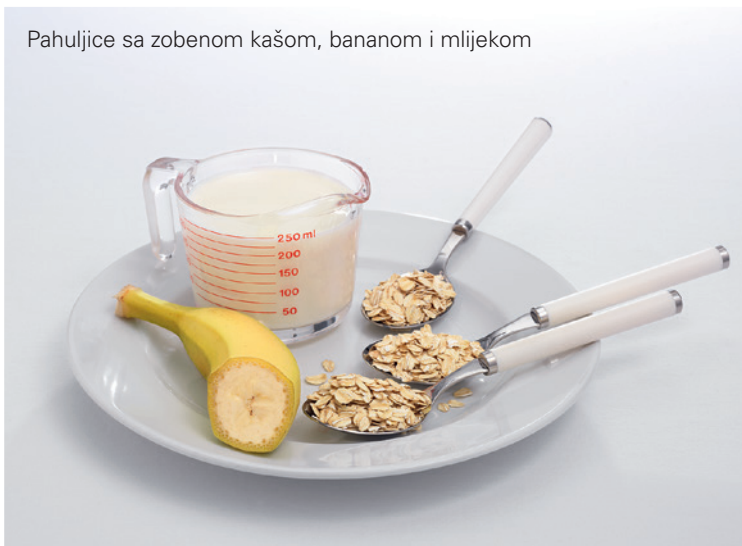
Pahuljice sa zobenom kašom, bananom i mlijekom